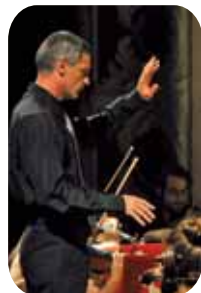
Jove Orquestra Simfònica De L'anoia

22 h TRIA L'HEREU I LA PUBILLA DE LA FESTA. Concurs on s'hauran de superar proves per demostrar que es pot ser un bon hereu i pubilla de la Coll@nada 2014. Inscripcions a les 21.40 h i a www.lacollanada.cat Ho organitza: assoc. juvenil La coll@nada a la plaça Pius XII