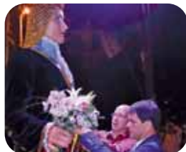
Lliurament del ram

al pati de la Igualadina Cotonera (c/ Joan Abad, 1-3)