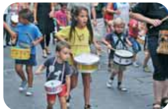
Tabalada menuda '13