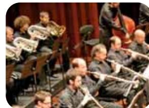
Cobla Sant Jordi