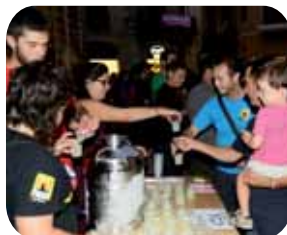
Tast de la pomada '13