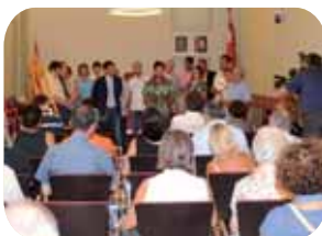
Presentació de l'estampa de Sant '13