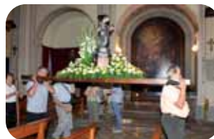
Trasllat del Sant

Ho organitza el Casino Foment. a la rambla de Sant Isidre