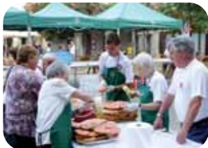
Esmorzar del Sant

De 10 a 13 h nens i nenes /de 16 a 21.30 h adults. Inscripcions obertes el mateix dia a la plaça o a www.ingravita.cat . Inscripcions a Ingravita o o mateix dia abans de començar.