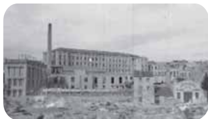
La Igualadina Cotonera