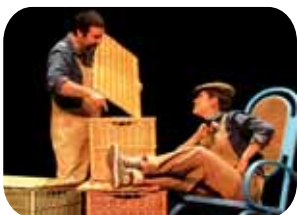
En contes d'un cove