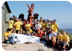
Grup Mal Llamp