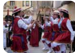
Exhibició de danses