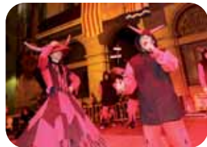
Versots i ball parlat