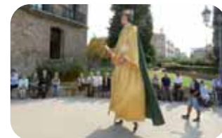
Visites a les residències