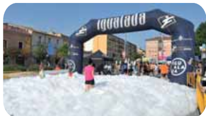
Trofeu Ciutat d'Igualada d'Orientació

Ho organitza: assoc. juvenil La coll@nada a la plaça de Pius XII