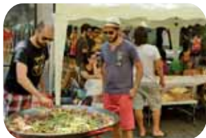
Fes-ta el dinar

Els Voladors, trabucaires d'Igualada; Drac Bufarot amb els Petits Diables i els Pixapòlvora d'Igualada; els Petits Mal Llamp; el Drac d'Igualada, la Víbria Jove d'Igualada amb els Diables d'Igualada; el drac Flameus, el Drac Voraxcis i el diables del Mal-Llamp d'Igualada; el Ball de Sant Miquel i els diables; el Bisbalet, la Cinta i els Capgrossos Carme i Caterina,