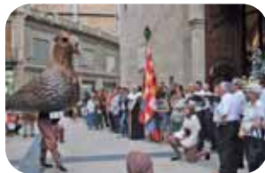
Processó del Sant