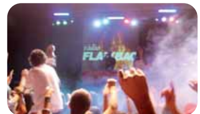
Tour de Ràdio Flaixbac